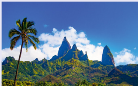
Gipfel der Insel Ua Pou