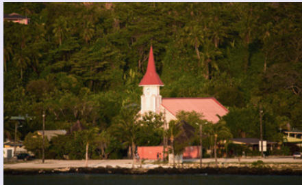
Katholische Kirche im Marquesas-Archipel